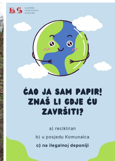
(Slika 8. i 9.) Poster i Gdje će ova kanta završiti?