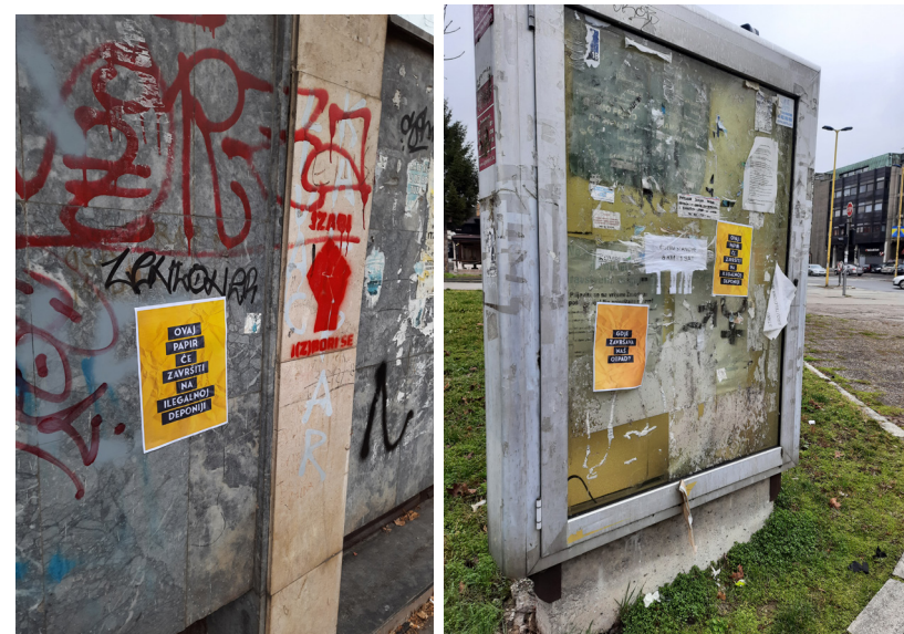
(Slika 6. i 7.) Ovak papir će završiti na ilegalnoj deponiji i Gdje završava naš otpad?