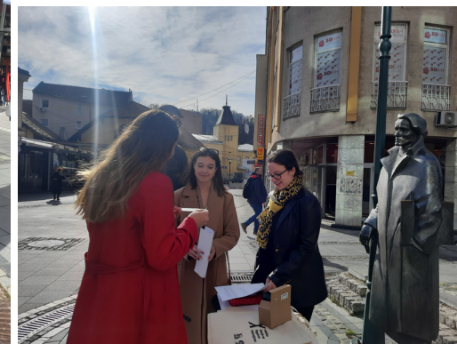
(Slika 1. i slika 2.) Ulična akcija – kviz pitanja i razgovor sa građanima/ kama