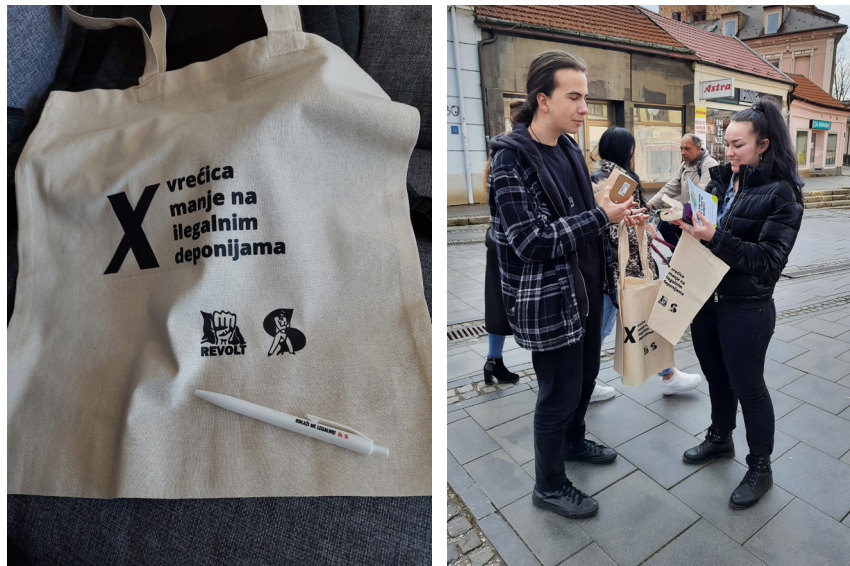
(Slika 13. i 14.) Ulična akcija – promocija kolaborativne intervencije