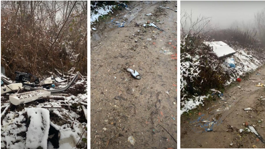
(Slika 10, 11. i 12.) Ilegalne deponije u Tuzli