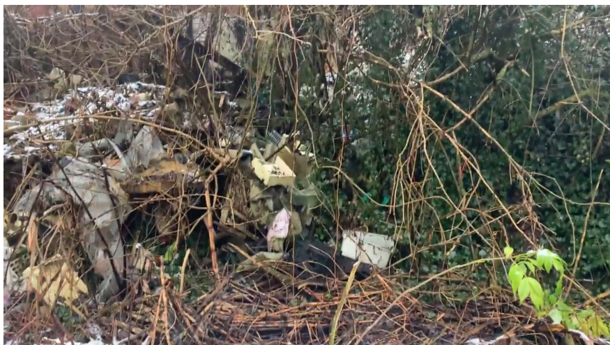
(Slika 4. i 5.) Divlje deponije u Tuzli